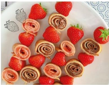
33. Aardbei-pannenkoek stokje