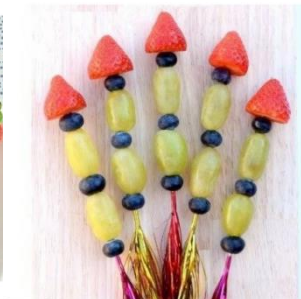
17. Fruit vuurpijlen