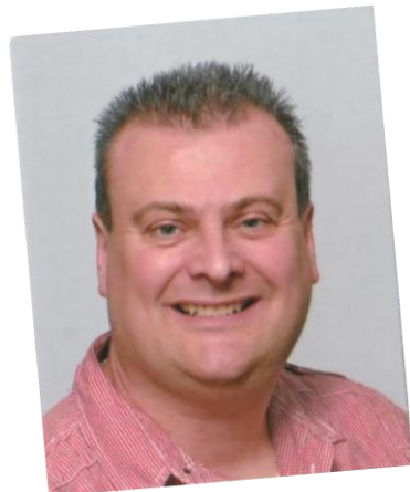
Maries Hesen Commissie Schoolvoetbal